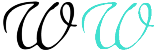
Figur 1: W-sektionens märke i svart och korrekt turkos.