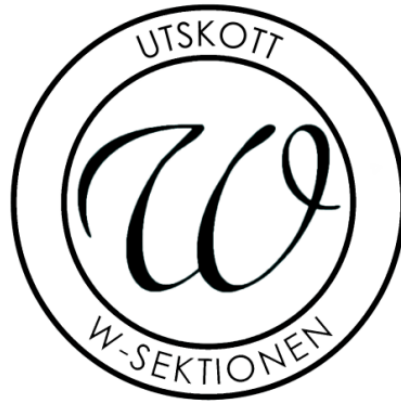
Figur 3: Utskottens logotyp